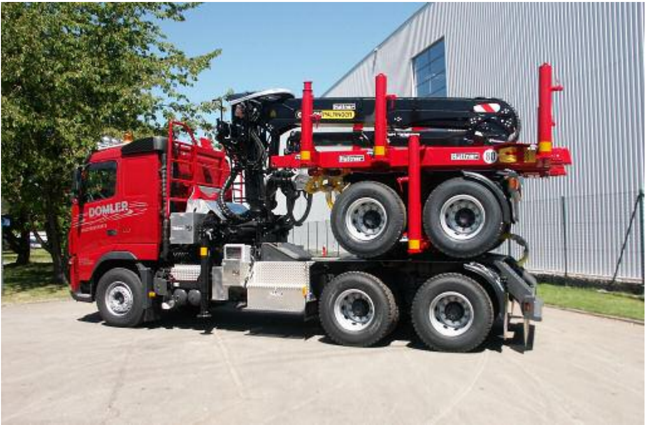
... über unseren Kombizug