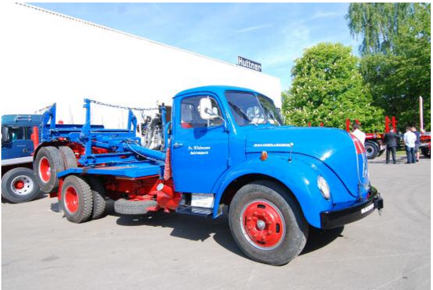
auch einige historische Holztransportfahrzeuge waren zu sehen