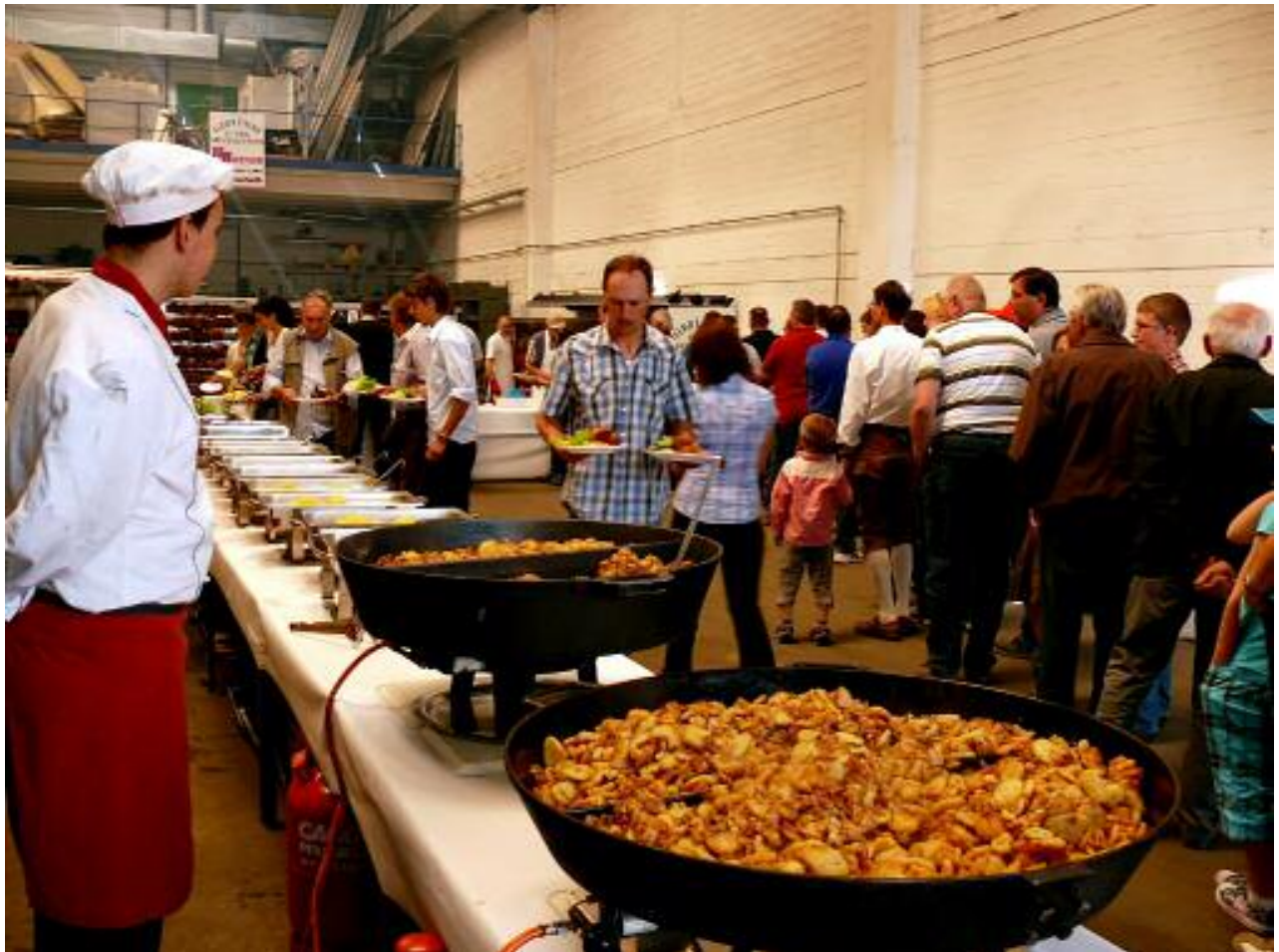
für Verpflegung war ausreichend gesorgt