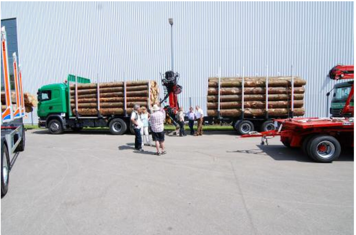
vom 1982 ersten gebauten Zwangslenker...