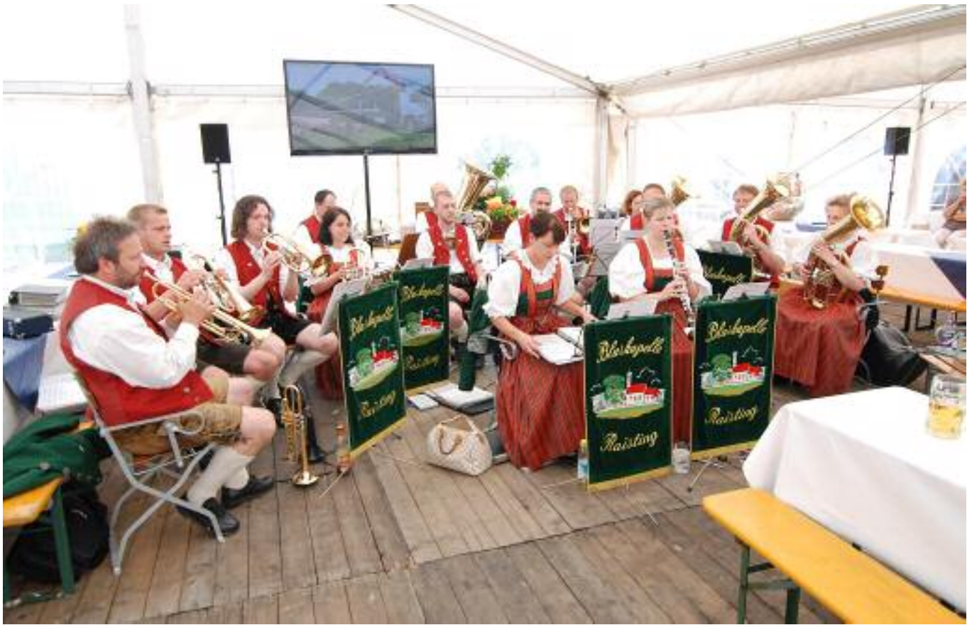
die Blaskapelle Raisting sorgte für Unterhaltung →