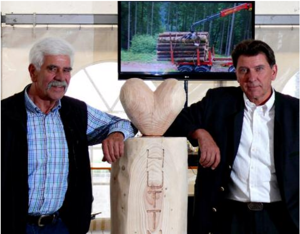
Geschenke vom Ministerpräsidenten und unseren treuen Partnern - DANKE!