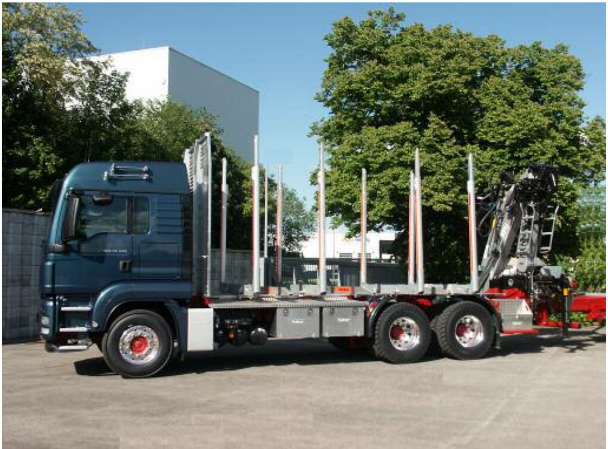
bis zum neu entwickelten HUTTNER Aluminium KH-Aufbau