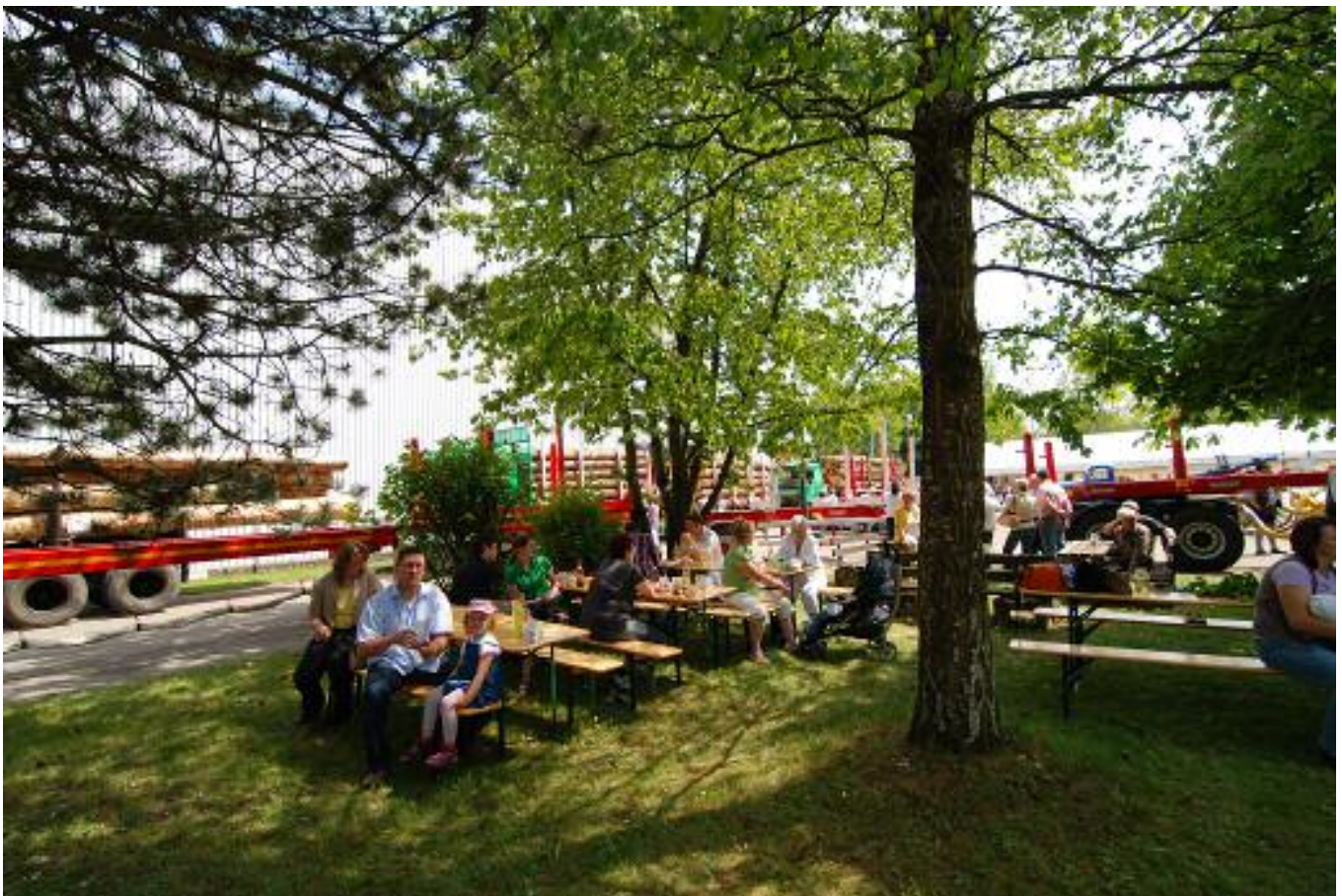
mit Hüpfburg für die Kinder und „ruhiges“ Schattenplätzchen für die Eltern