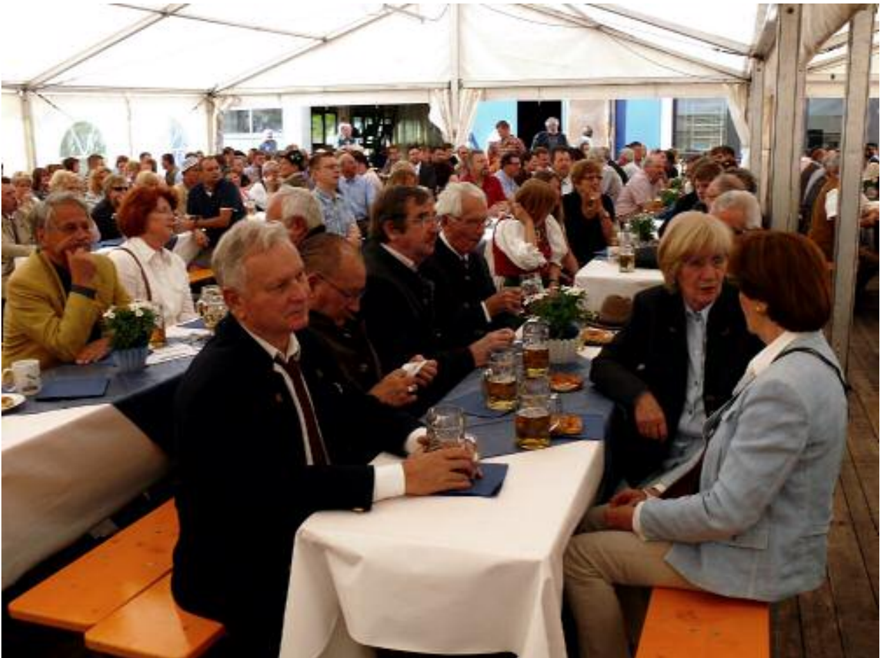
800 Sitzplätze waren bald gefüllt