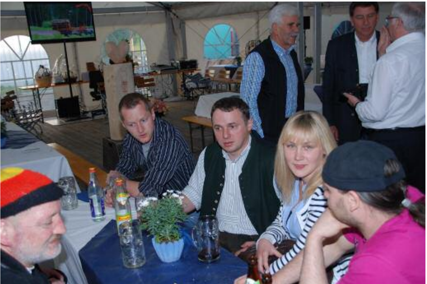
die gute Stimmung hielt bis in die Nacht...